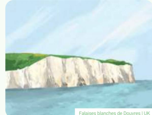
Falaises blanches de Douvres | UK