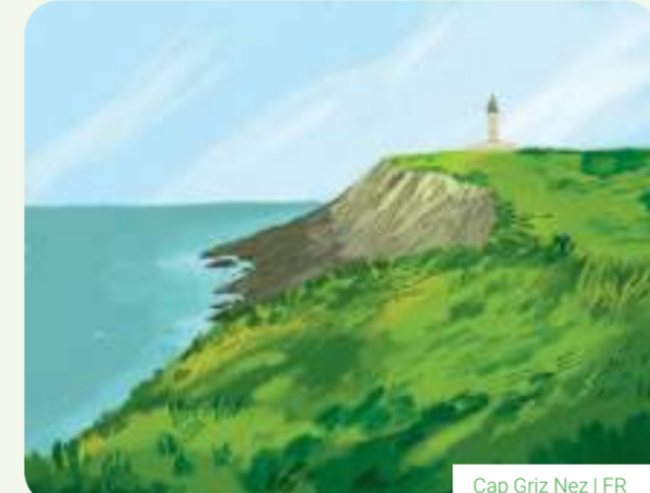
Cap Griz Nez | FR