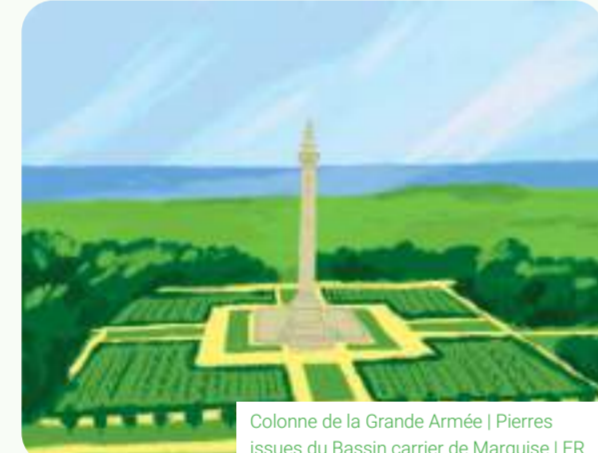
Colonne de la Grande Armée | Pierres issues du Bassin carrier de Marquise | FR