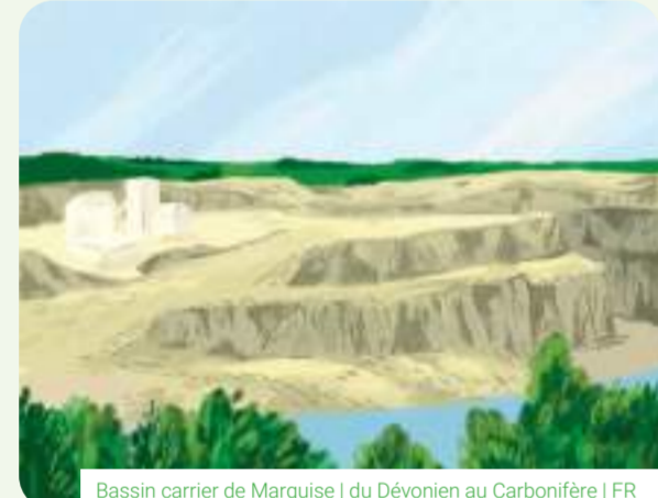
Bassin carrier de Marquise | du Dévonien au Carbonifère | FR