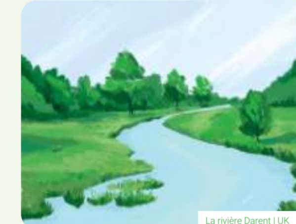
La rivière Darent | UK